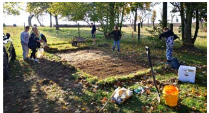
Die 6. Klassen legten zwei Blühwiesen an.

Gesponsert wurden diese Pflanzen vom Rotary-Club Gera-Osterland. Gleich daneben auf unserer Obststreuwiese bepflanzte die Klasse 8 unserer Schule fünf neue Obstbäume.