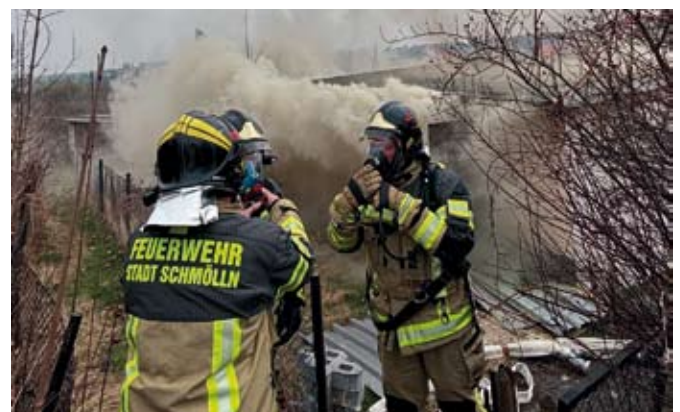
Brand einer Gartenlaube am Hainanger

Fast zur gleichen Zeit dann zwei Einsätze am folgenden Freitag. Um 12:46 Uhr wurde zunächst zu einer Hubschrauberlandung alarmiert. Nur drei Minuten später die nächste Alarmierung, diesmal zu einem Gartenlaubenbrand im Hainanger. Um beide Einsätze adäquat abuarbeiten wurde die Ortsteilfeuerwehr Großstößnitz nachalarmiert. Als die Einsatzkräfte am Hainanger eintrafen, brannte eine leerstehende Laube in voller Ausdehnung. Mehrere Trupps unter Atemschutz kamen zur Brandbekämpfung zum Einsatz. Nachlöscharbeiten erforderten unter anderem auch das Öffnen des Daches, um alle Glutnester zu erreichen.