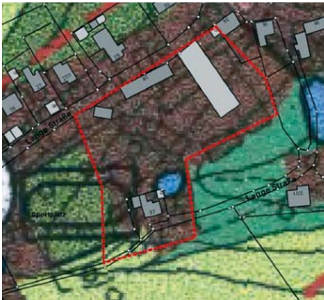
Schmöln, 19. März 2024

Die im Flächennutzungsplan zu ändernden Bereiche sind in dem nachfolgend abgedruckten Lageplan ersichtlich.