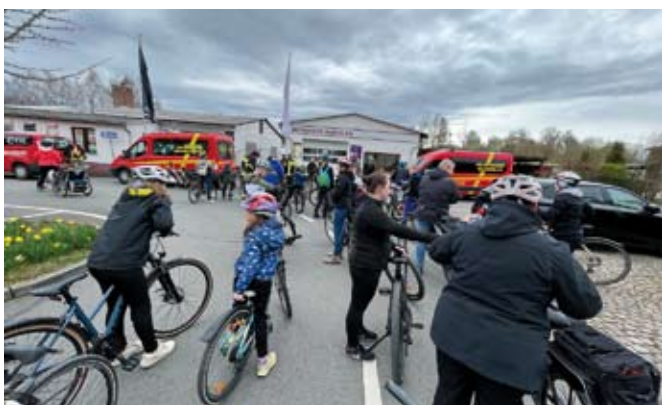
Kurze Pause bei der Radtour der Jugendfeuerwehren am Karfreitag

Am Karfreitag führten die Jugendfeuerwehren Großstöbnitz, Schmölln und Zschernitzsch ihre traditionelle Radtour durch. Gemeinsam ging es bei durchwachsenem Wetter auf eine tolle Runde über Bohra, Burkersdorf und Schmölln nach Zschernitzsch. Dort hatte der Osterhase kleine Osterester versteckt. Nach der Suche stärkten sich alle noch mit leckerem Essen vom Grill, ehe man in die Osterfeier- tage startete.