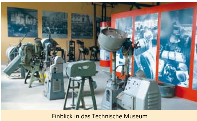
Einblick in das Technische Museum

Das Knopf- und Regionalmuseum Schmölln sucht ehrenamtliche Mitarbeiter:innen, die vorrangig zu den Öffnungszeiten am Wochenende die Maschinenhalle/den technischen Teil des Museums in der Ronneburger Straße betreuen.