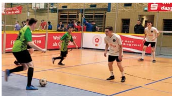
Die Nemzer Haie beim Qualifikationsturnier in Altenburg

So finden in diesem Jahr weitere Bundesländer den Weg zum ersten Mal an den Werbellinsee, zum Finale von Deutschlands größtem Soccerturnier.