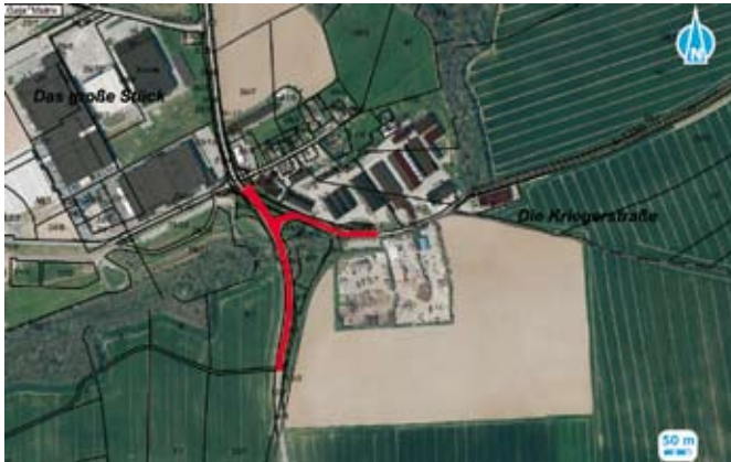
Halbseitige Sperrung der Abfahrt am Kreisverkehr an der Thomas-Müntzer-Siedlung in Richtung Kummer und A4

Hier wird die Fahrbahn saniert. Bauausführende Firma ist Kutter HTS GmbH.