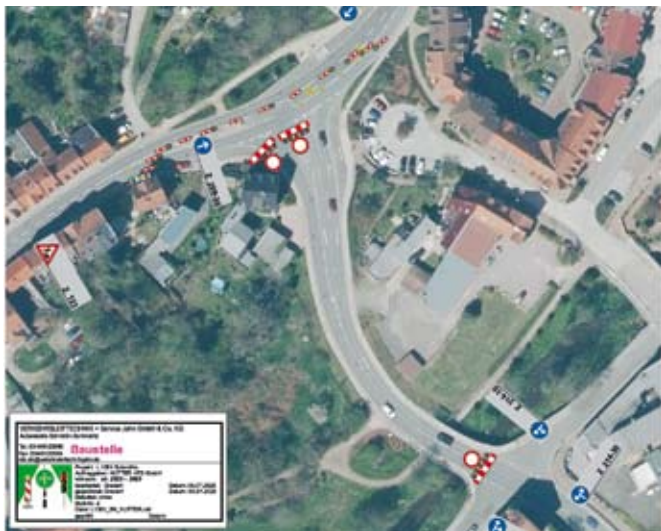
Sperrung der Bachstraße

Die Umleitung von der A4 in Richtung B7 Altenburg/Ronneburg wird über Kummer und Nitzschka ausgeschildert.