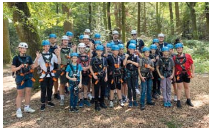
Beim Ferienlager in Mühlacker waren die Kids unter anderem im Kletterwald aktiv

Bereits am ersten Augustwochenende war ein Teil der Jugendfeuerwehr beim Ferienlager in der Partnerfeuerwehr Mühlacker zu Gast. Neben einer gemeinsamen Ausbildung und einer Einsatzübung stand der Besuch des Kletterwaldes in Pforzheim genauso auf dem Plan wie die Besichtigung der neuen Mühlacker Feuerwache. Im Mittelpunkt natürlich das Kennenlernen der Jugendgruppen, was auch super gelang. Am Ende des Wochenendes konnte man nicht nur von tollen Erlebnissen berichten, sondern auch von entstandenen Freundschaften und einer Vertiefung der partnerschaftlichen Beziehungen.