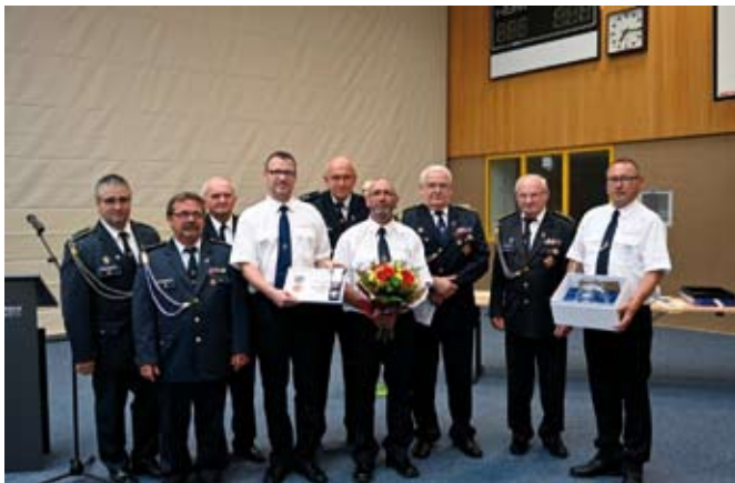
Bei der Festsitzung in der Ostthüringenhalle überbrachten auch die Gäste aus Dolni Loucky Präsente