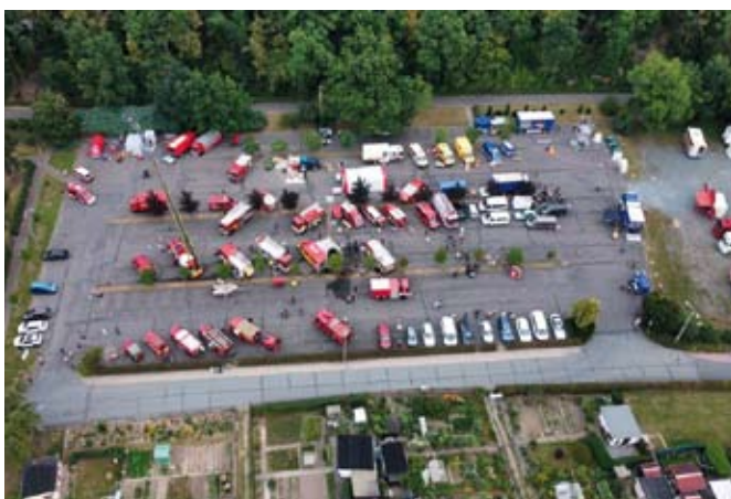
Die Blaulichtmeile lockte zahlreiche Besucher an

Schätzungsweise mehr als 1.000 Besucher bestaunten danach ab Mittag die Ausstellungen zur Geschichte der Feuerwehr sowie zur aktuellen Technik von Feuerwehren des ganzen Landkreises, des THW und der Johanniter Unfall-Hilfe. Und auch historische Technik konnte bestaunt werden.