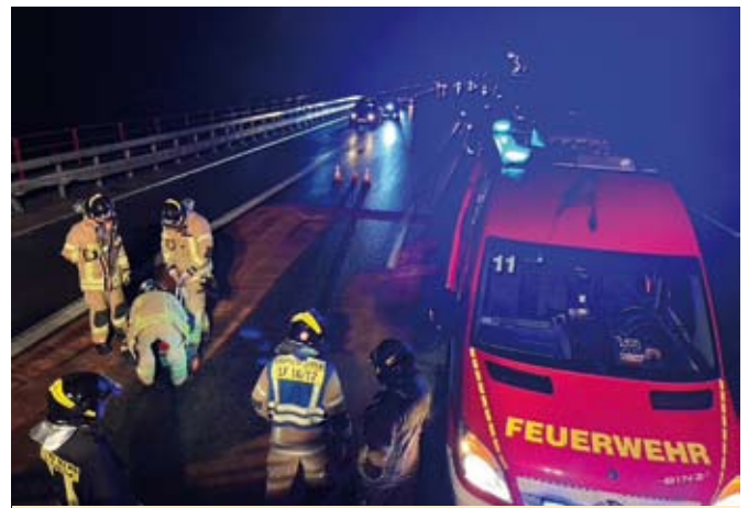
Bei einem Unfall auf der BAB 4 kamen die Einsatzkräfte der Hauptwache zum Einsatz

Nach vier Stunden konnte Feuer aus gemeldet werden. Direkt am nächsten Tag erneut eine eingelaufene Brandmeldeanlage. Bereits auf der Anfahrt erhielten die Kräfte die Information, dass wieder eine Filteranlage brennen würde. Diesmal konnten die Arbeiten auf ein Minimum beschränkt werden, da das Feuer rasch gelöscht werden konnte. Nach einer Stunde war auch dieser Einsatz beendet.