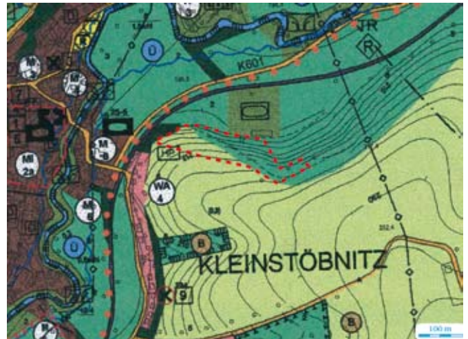
3. Geltungsbereich der 5. Änderung des Flächennutzungsplans der Stadt Schmölln