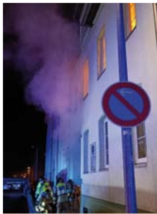
Dichter Rauch dringt aus einem Mehrfamilienhaus in der Altenburger Straße

Großalarm für die Hauptwache dann am 21. April: Nachts um 01:42 Uhr melden Anwohner eines Mehrfamilienhauses in der Altenburger Straße eine Rauchentwicklung im Treppenhaus. Der Fluchtweg ist abgeschnitten, mehrere Personen – darunter auch ein Kind – sind eingeschlossen. Neben dem Löschzug der Hauptwache werden zahlreiche Rettungsmittel des Rettungsdienstes alarmiert. Zwei Trupps unter Atemschutz gehen direkt nach der Ankunft zur Menschenrettung und Lageerkundung vor.