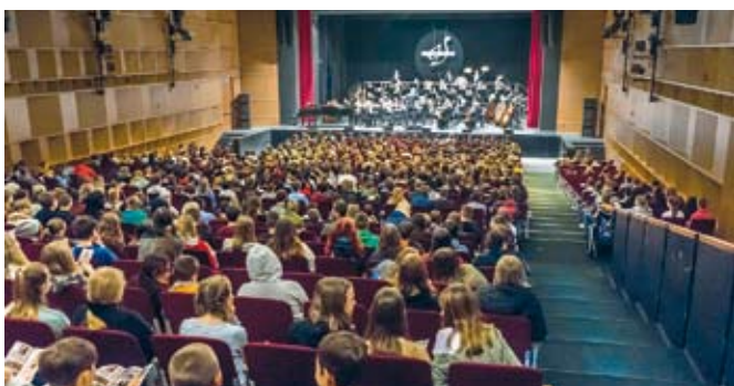
Blick in die Konzerthalle der Vogtland Philharmonie

Eine Musikstunde der besonderen Art erlebten wir, die Schüler*innen der Klassen 5, 6 und 7 der Staatlichen Regelschule Nöbdenitz, Anfang März in der Vogtlandhalle in Greiz. Am späten Vormittag fuhren wir mit dem Zug nach Greiz – das war schon ein Erlebnis – und lernten die Vogtland Philharmonie kennen. Die Werke „Die Moldau“ und „Bilder einer Ausstellung“ standen auf dem Stundenplan des Schülerkonzertes „Kids meet Classic“.