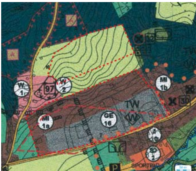
1. und 2. Geltungsbereich der 5. Änderung des Flächennutzungsplans der Stadt Schmölln

Der Geltungsbereich der 5. Flächennutzungsplanänderung ist aus den nachfolgenden abgedruckten Lageplänen ersichtlich.