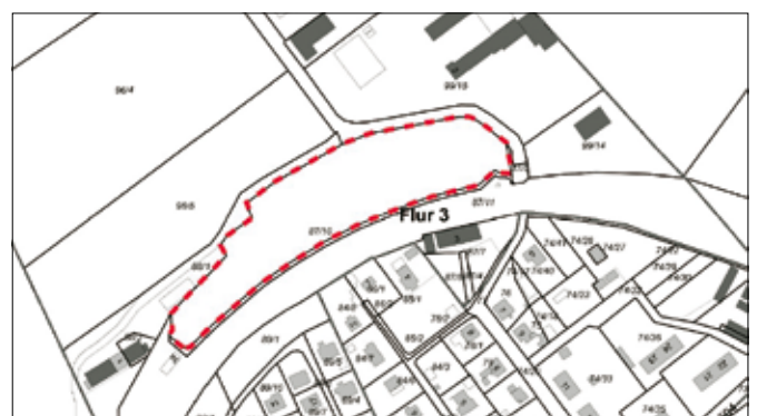
Abb.1: Geltungsbereich vorhabenbezogenen Bebauungsplan mit integriertem Vorhaben- und Erschließungsplan – Sondergebiet Solarenergie – „P+R mit PV-Anlage Nöbdenitz Bahnhofstraße“ (Gemarkung Nöbdenitz; Flur 3)

Der Geltungsbereich des 3. Entwurfs zum vorhabenbezogenen Bebauungsplan mit integriertem Vorhaben- und Erschließungsplan – Sondergebiet Solarenergie – „P+R mit PV-Anlage Nöbdenitz Bahnhofstraße“ ist aus dem nachfolgenden abgedruckten Lageplan (Abb. 1) ersichtlich.