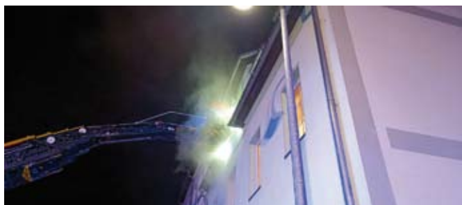
Mehrere Personen wurden bei einem Brand in der Altenburger Straße über die Drehleiter gerettet

Zwei Personen werden mittels Fluchthauben durchs Treppenhaus gerettet, zwei über die Drehleiter. Bei der Erkundung stellt sich derweil die Ursache der Verrauchung heraus: Eine Pelletheizung. Durch eine Fehlfunktion kam es zum Brand und die Rauchentwicklung. Nach drei Stunden waren alle Kräfte wieder im Gerätehaus. Alle vier Personen wurden rettungsdienstlich versorgt.