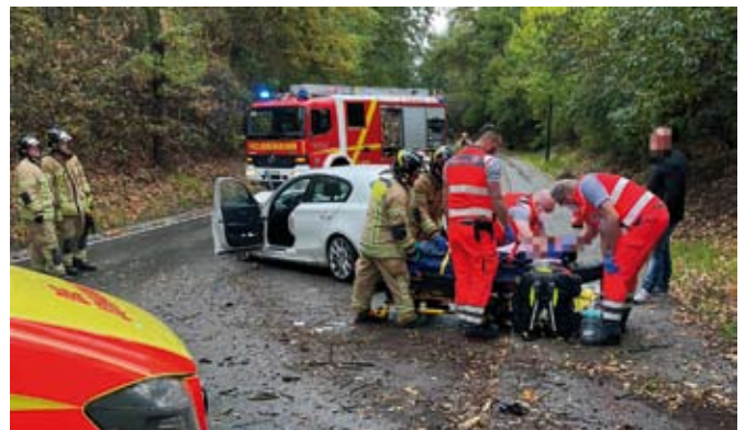
Erheblicher Sachschaden entstand an einem PKW bei einem Unfall in der Crimmitschauer Straße. Der Fahrer wurde ebenfalls verletzt.

Zwei Tage später ereignete sich gegen 15:00 Uhr ein Verkehrsunfall im Bereich der Crimmitschauer Straße. Ein PKW-Fahrer verlor in einer S-Kurve die Kontrolle über sein Fahrzeug, kam ins Schleudern und kollidierte mit einem Baum. Bei Eintreffen der Feuerwehr war der Fahrer bereits aus seinem Fahrzeug befreit. Die Kräfte sicherten die Einsatzstelle ab und unterstützten den Rettungsdienst bei der Erstversorgung. Nach einer guten Stunde konnte die Einsatzstelle an die Polizei übergeben werden.