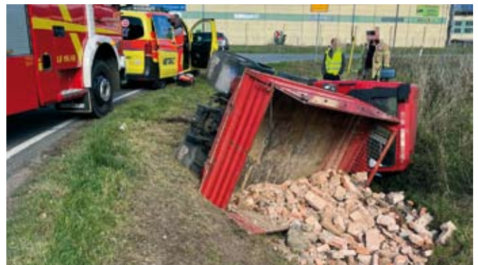
Ein Multicar ist samt Ladung im Bereich Thomas-Müntzer-Siedlung in den Straßengraben gerutscht und umgekippt.

Am Nachmittag des 11. kippte ein Multicar auf der L1361 beim Abbiegen in den Straßengraben. Der Fahrer wurde vorsorglich zur Behandlung in ein Krankenhaus gebracht. Die Feuerwehr sicherte die Einsatzstelle ab und unterstützte bei der Bergung des Fahrzeugs.